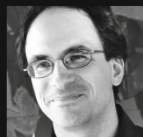
Oliver Waespi Komponist